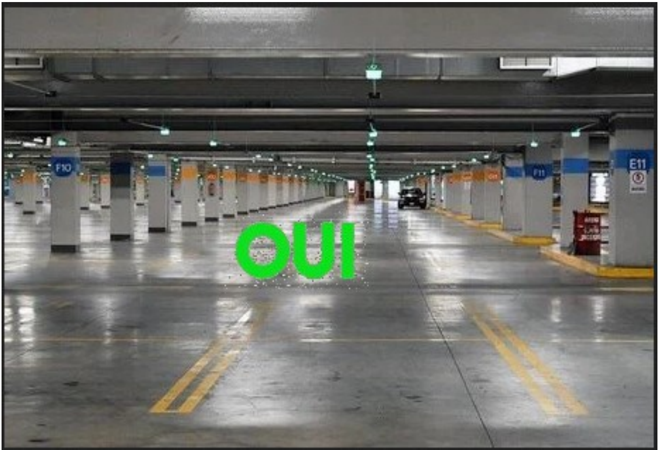
Hauteur sous plafond 5M